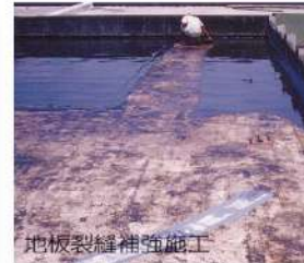
地板裂縫補強施工